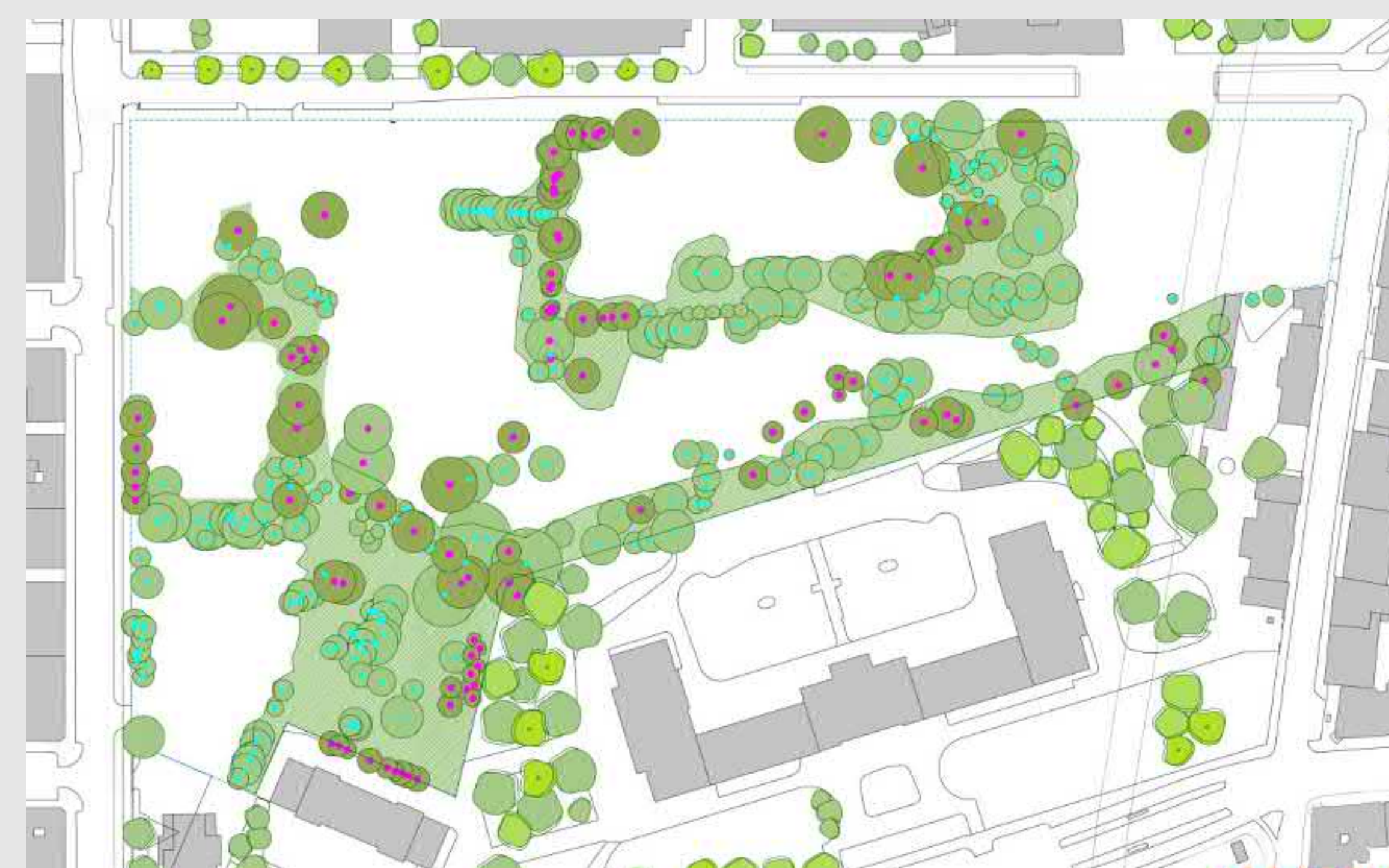
Lageplan erhaltenswerter Baumbestand - driendl*architects