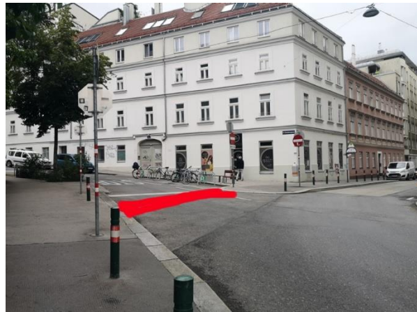
Kreuzung Esterházygasse/Magdalenenstraße aus verschiedenen Perspektiven