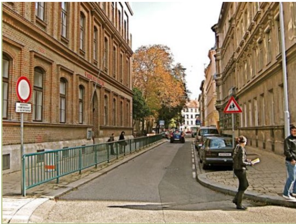
Eingangsbereich zur Volksschule in der Kolonitzgasse 15

Der Platz vor der Volksschule, als Schnittstelle zwischen Bildungseinrichtung und Stadtteil, repräsentiert eine einzigartige Form des öffentlichen Raums mit erheblichem Potenzial. Leider wird dieses Potenzial als Begegnungs- und Freiraum für Schüler:innen und Anrainer:innen dabei selten ausgeschöpft. Dies soll durch einen autofreien Schulvorplatz ermöglicht werden.